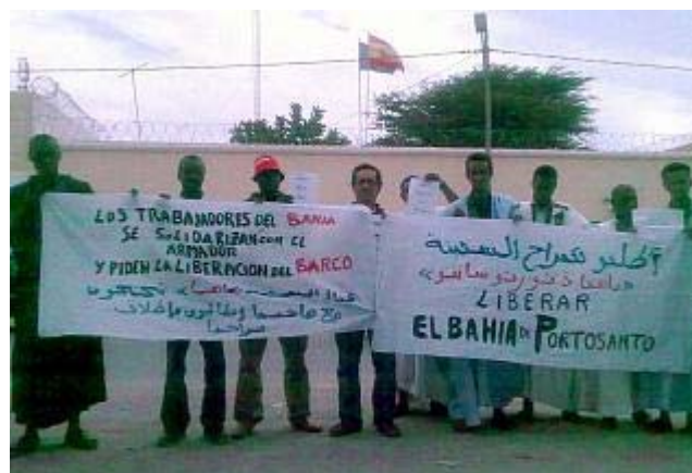
El armador del 'Bahía de Portosanto' deja la huelga ante la liberación del barco la opinión

El pesquero con base en Marín (aunque su armador, de 62 años, es vecino de Poio), cumple ya 139 días retenido en el puerto de Nuadibú después de que el pasado 20 de agosto se viera envuelto en una colisión con otro buque de la zona que acabó hundiéndose. Tras cuatro meses y medio sorteando obstáculos legales, a finales de la pasada semana parecía que la pesadilla iba a llegar a su fin cuando el Tribunal Supremo de Mauritania fijaba una fianza de un millón de dólares para como garantía por el accidente para que el barco pudiera dejar el puerto africano. No obstante, las autoridades mauritanas se negaban a aceptar la carta de pago que remitió la Mutua de Buques de España como garantía de esa fianza.