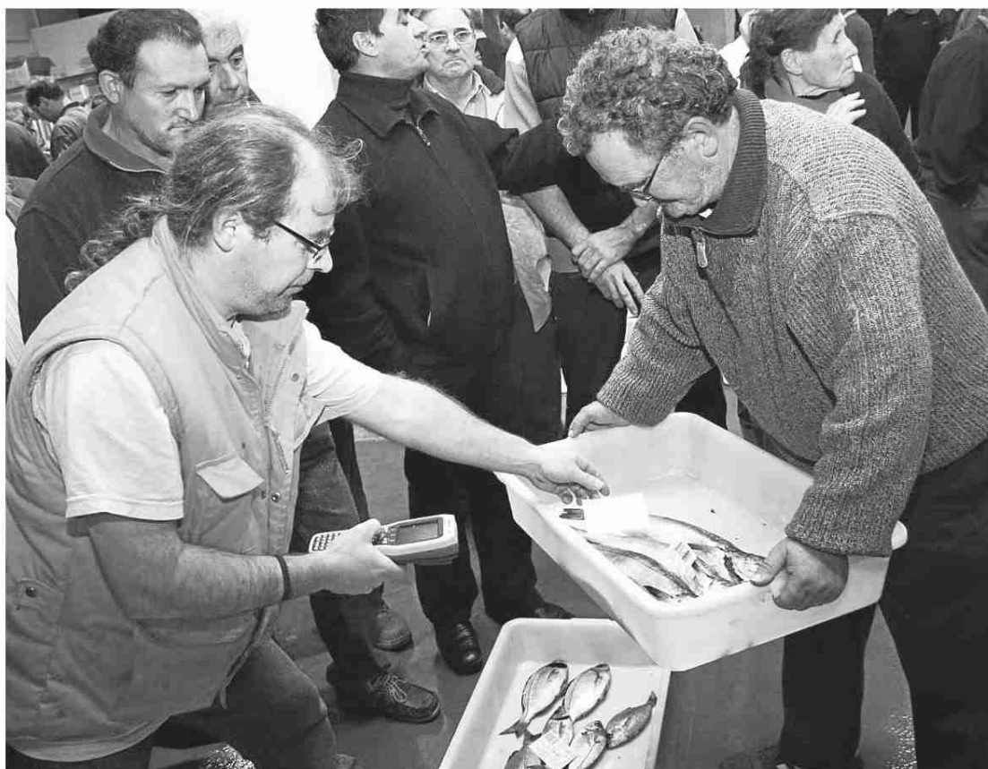
La facturación en la lonja de O Grove descendió casi 300.000 euros en diciembre en comparación con 2008.

De este modo, a pesar de que el número de kilos fue muy similar (tan solo se vendieron doce kilos más en 2008), la recaudación se vio afectada, ya que en 2009 se