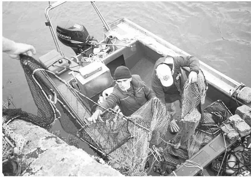
Una de las dos embarcaciones de lamprea que salieron a faenar en los primeros días de campaña.