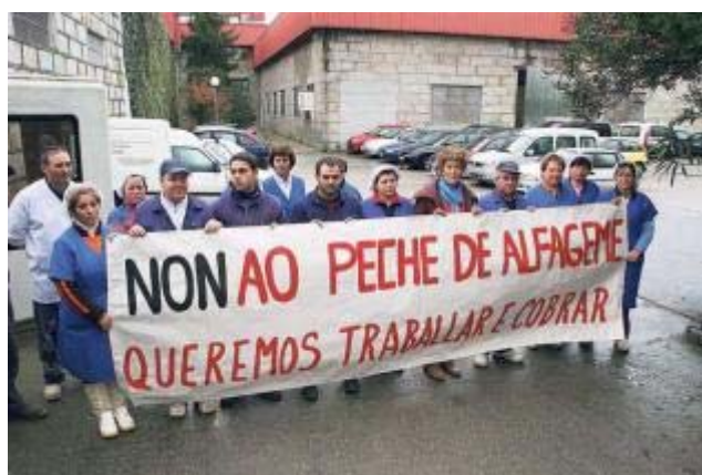
Imagen de una concentración anterior de las trabajadoras de Alfageme a las puertas de la sede de Vilaxoán, en Vilagarcía.

El sindicalista entiende que el tiempo se acaba y que "el mismo gerente ha venido para una cosa y si ve que