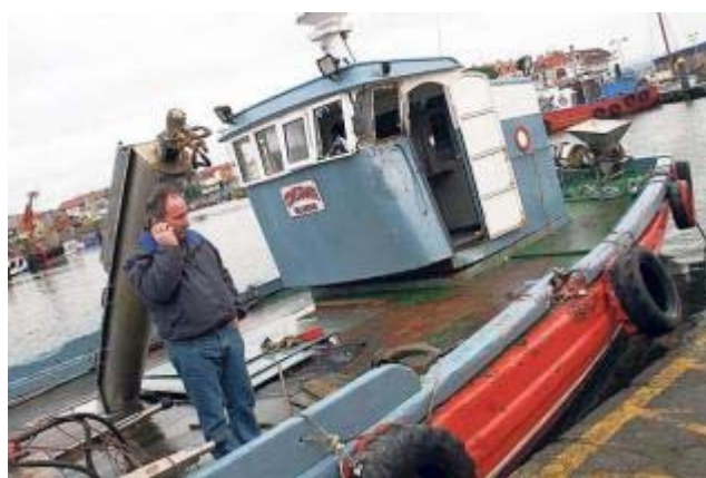
El armador del "Constante" contempla los destrozos provocados por el abordaje. J.L.Oubiña

El último incidente ocurrió hace muy pocos meses, cuando un marinero jubilado amarró su lancha en el pantalán de los bateiros. El propietario del barco no se percató de este hecho y salió al mar sin darse cuenta de que llevaba amarrada por un costado la lancha, que terminó por semihundirse en las inmediaciones de la playa de As Sinas. Unas horas después fue descubierta por otro barco, que alertó de un posible naufragio en la ría de Arousa. De inmediato se movilizaron efectivos de Salvamento Marítimo y de la Guardia Civil, aunque